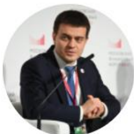
Котюков Михаил Заместитель министра финансов России