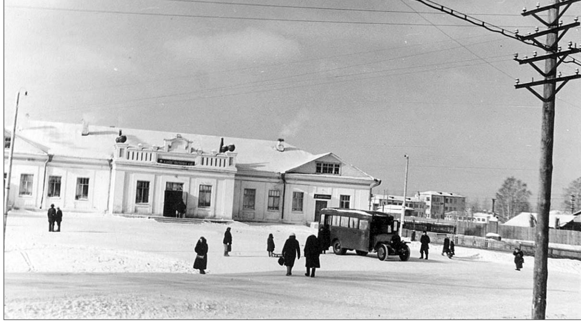
«Белый» магазин в Парахино. 50-годы прошлого века