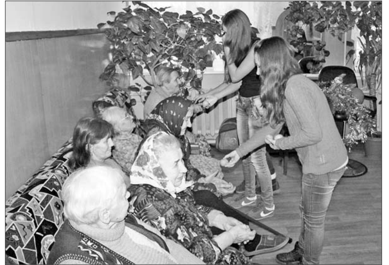
Волонтеры в Доме ветеранов