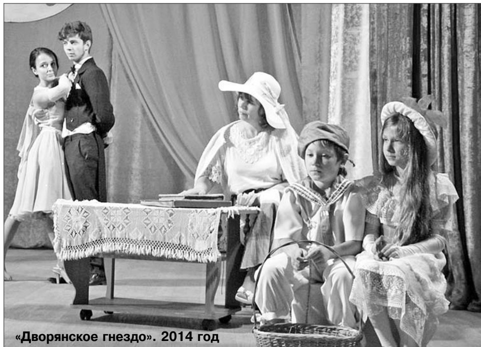
«Дворянское гнездо». 2014 год

День посёлка, фестивали, конкурсы, развлекательные программы, музыкально-поэтический фестиваль «Дворянское гнездо»... Перечислять воплощённые в жизнь творческие идеи директора Кулотинского Дома культуры можно очень долго. Это любимая, но работа, служебные обязанности, а есть ещё и личное творчество, свой собственный способ самовы-