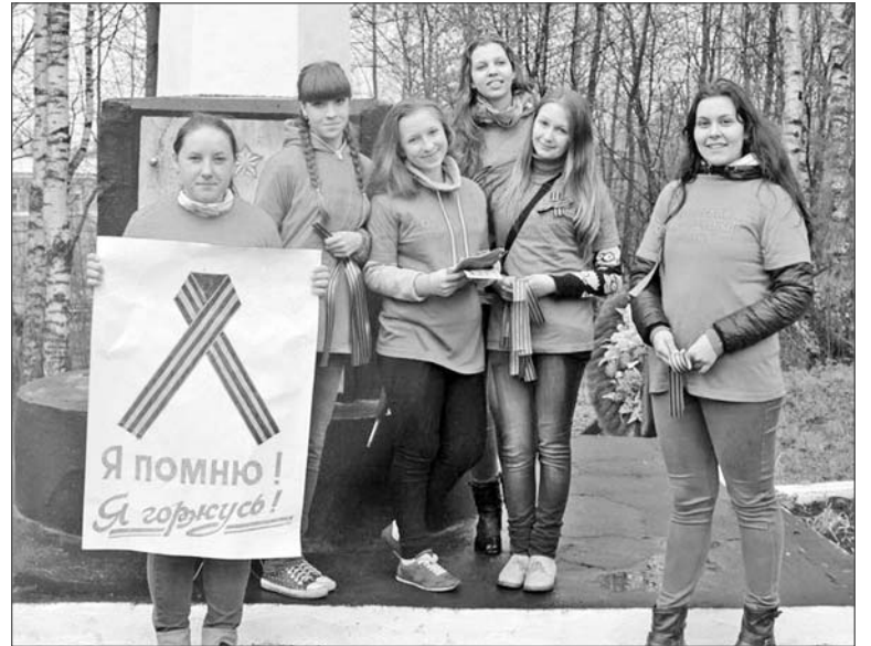
Участники акции «Георгиевская ленточка»