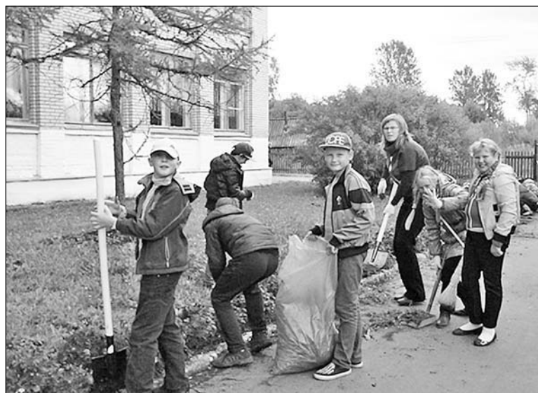
Угловские школьники участвуют во Всероссийском субботнике