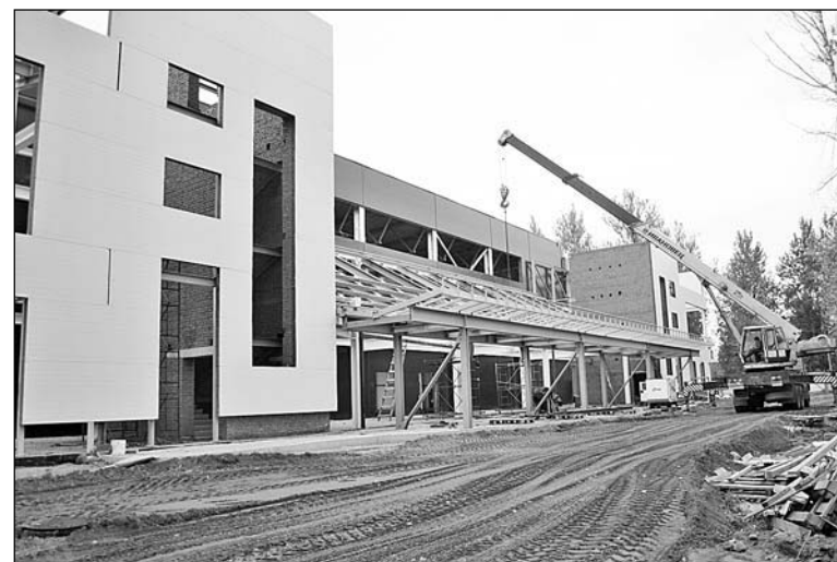
Строятся физкультурно-оздоровительный комплекс и гребной канал