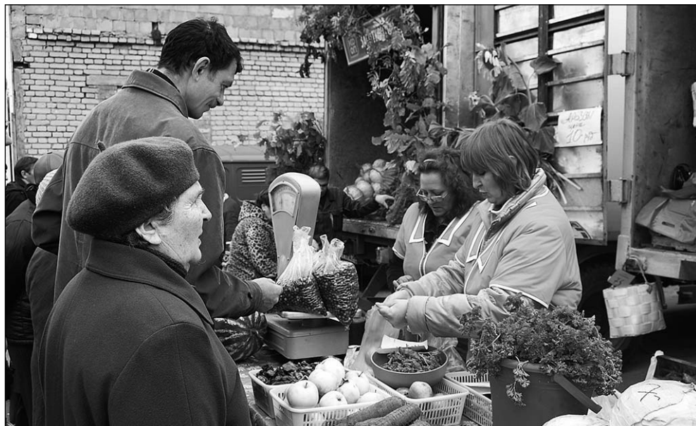
Новгород становится центром притяжения для реализации сельхозпродукции из районов