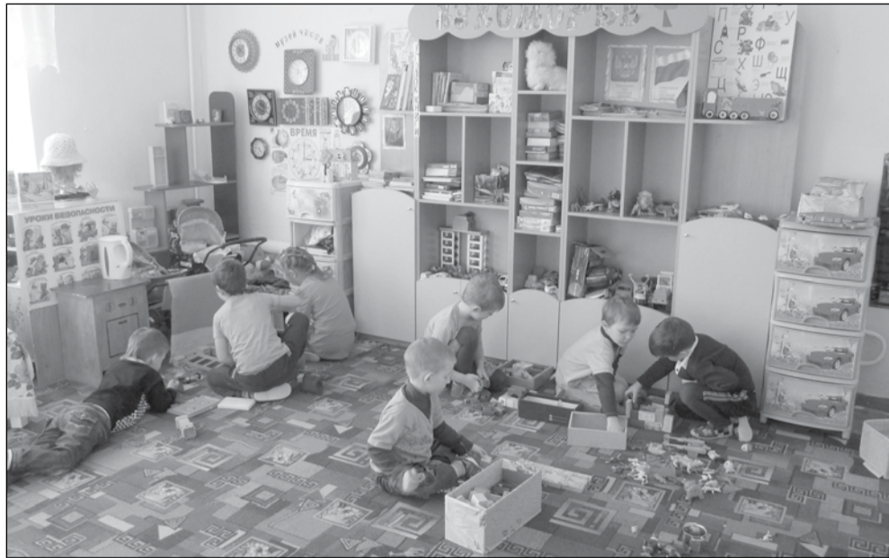
Благодаря помощи спонсоров в группах детского сада п.Угловка тепло и уютно

— Поясню вкратце механизм действий в такой ситуации. Ремонты плотины и РЦТ не были запланированы в этом году, соответственно расходы районного бюджета на эти цели не предусматривались. Значит, первым делом Дума муниципального района вносит изменения в бюджет. Теперь можно объявлять аукцион на подготовку документации. На каждый этап установлены сроки. Так, извещение о проведении электронного аукциона размещается в единой информационной системе в зависимости от начальной суммы: если более 3 млн. — за 20 дней, менее 3 млн. рублей — за 13 дней до даты проведения аукциона, при условии, что он состоялся, то есть подано две и более заявки на участие.