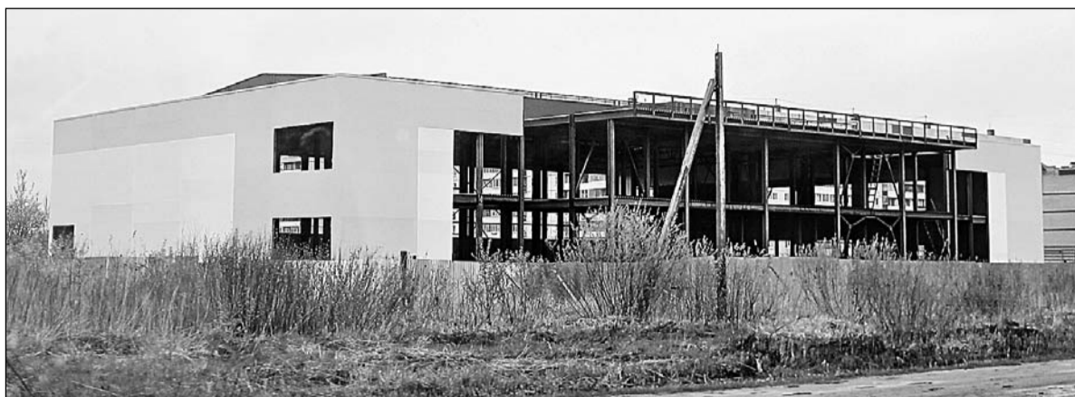
Таким мы видим этот объект уже полтора года

Но чем чреваты субвенции? Выделяемые средства нужно освоить в конкретный срок. Конкретно эти — в Вишере и Окуловке — до конца 2015 года. А еще