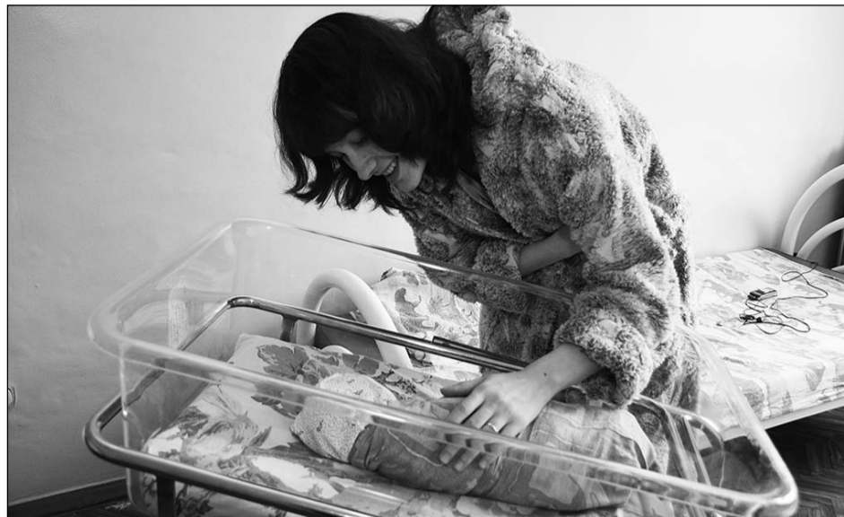
Самый высокий уровень рождаемости отмечен в Новгороде и Крестецком районе