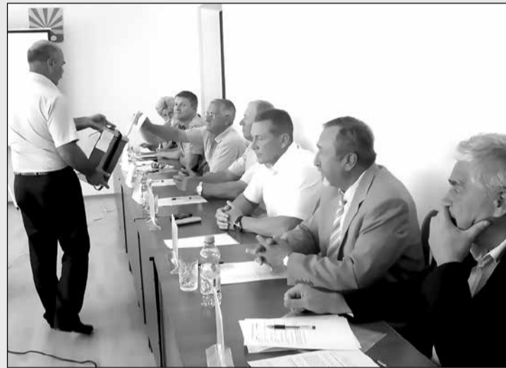
Идёт тайное голосование