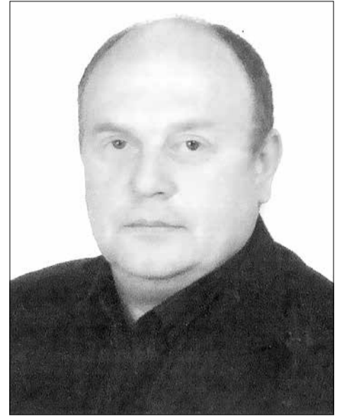
Публикуется на безвозмездной основе.

– Увеличение доходности бюджета путём повышения содействия развитию производства.