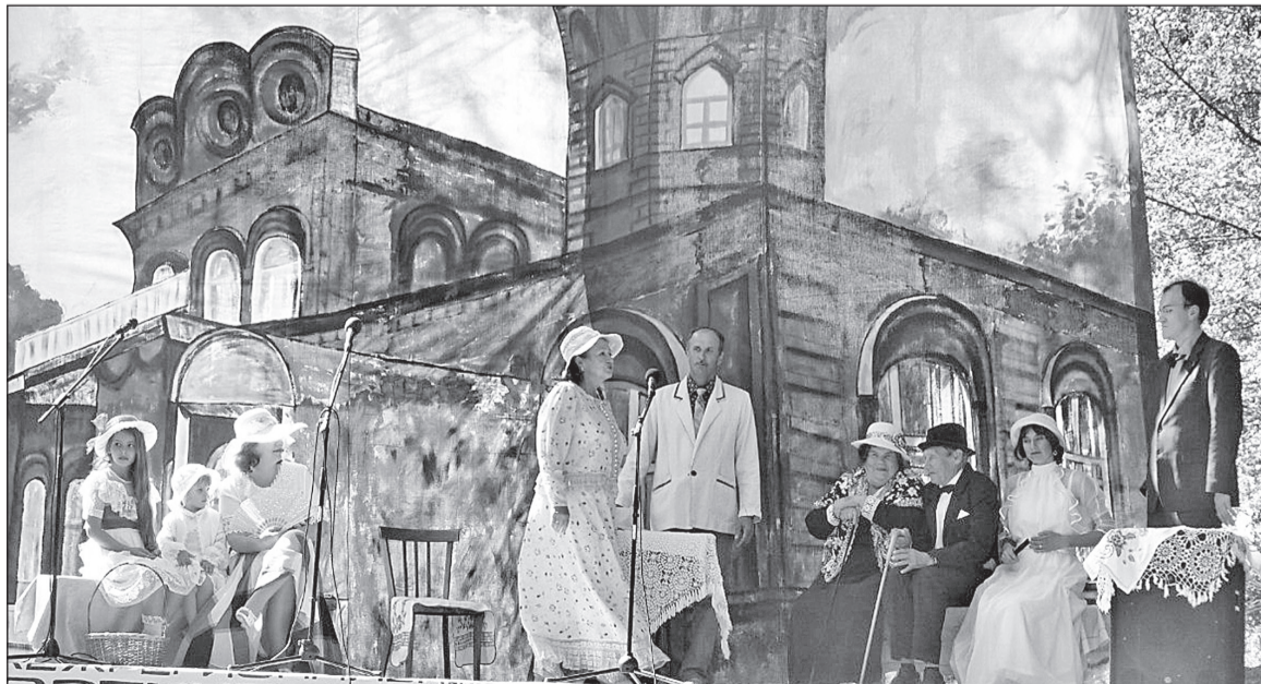
Приволье. Дворянское гнездо. Театр «Жили-Были...»