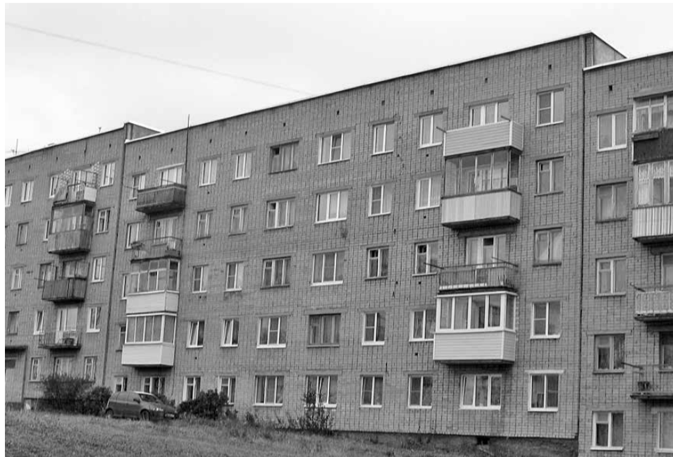
На доме № 42 корпус 1 по улице Островского установлена новая кровля

По Окуловскому району в программе капитального ремонта текущего года участвуют 19 домов. В рамках её реализации обновлены кровли на домах № 3 по улице 1 мая, № 42 корпус 1 по улице Островского, № 27 по улице Володарского, двух домов в посёлке