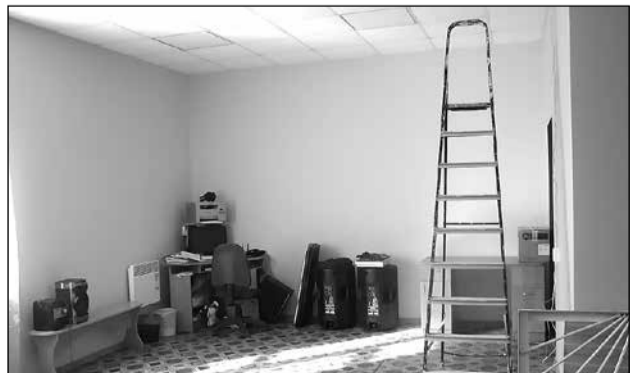
Обновлённая комната кружковой работы МКДЦ

Подготовила Ирина КРУГЛОВА