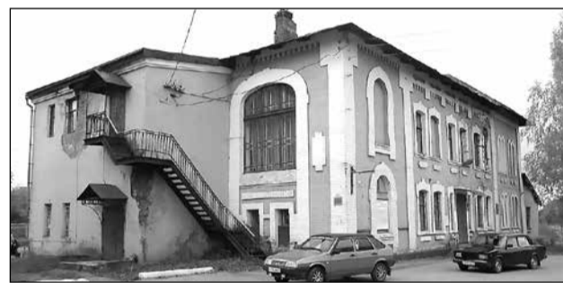
А районный центр творчества пока ждёт ремонта...

В итоге – бывший клуб железнодорожников, конечно, будет отремонтирован, но потеряно драгоценное время. Сложившаяся ситуация ещё раз подтверждает: многое зависит от человеческого фактора, старательности и ответственности того, кому поручено дело. Подготовительные и конкурсные процедуры по ремонту этого объекта были начаты одновременно с подготовкой проектно-сметной документации на ремонт моста через Перетну в районе бумажной фабрики. Но допущенная волокита и ненадлежащее исполнение своих обязанностей некоторыми должностными лицами привели к той разнице, что мы видим на настоящий момент. Мост ремонтируется полным ходом, нет сомнений, что все получится и,